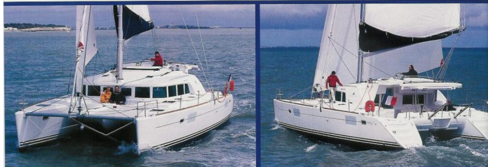
Das Mittelcockpit auf dem Aufbau sorgt für freie Sicht. Die senkrechten Fenster bringen volle Stehhöhe im Salon. Der Bugspriet für den Rollgennaker erlaubt perfektes Handling – dies sind nur einige der vielen praktischen Details der neuen Lagoon 440

Das neueste Modell der zur Bénéteau-Gruppe gehörenden Lagoon-Katamarane, die Eigenversion der 440, zeichnet sich durch eine Reihe durchdachter, sehr praktischer Details, einfaches Handling und hohem Wohnkomfort aus. Ein Test von Michael Bohmann