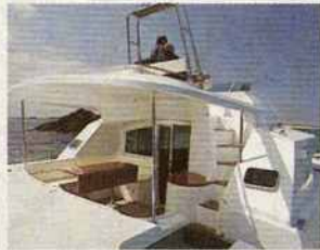
Gemütlicher Freisitz unterm Dach für Mußstunden an Bord

Katamarane mit Motorantrieb sind hier zu Lande selten. Doch wer einmal einen gesteuert hat, ist begeistert von Dynamik und Raumangebot. Die WELT testete die neue Lagoon Power 43